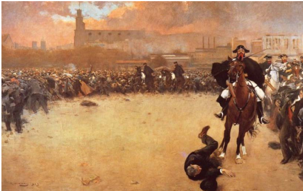
La càrrega o Barcelona 1902

FONT: Ramon Casas, 1899 (Museu de la Garrotxa, Olot).